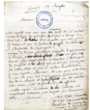
Lettre autographe de Mgr Dombidau, 1805

Les documents les plus rares et les plus précieux des collections de l'évêché, archives et bibliothèque associées, ont été numérisés et sont présentés ici : le Bréviaire de Landerneau (manuscrit de 1450) le Missel de Léon (1526), la correspondance de Mgr Dombidau de Crouseilhes (1800). D'autres documents, pour leur rareté et leur place dans l'histoire religieuse régionale, peuvent provenir d'une collection privée et être ici communiqué avec l'aimable autorisation du propriétaire. C'est ainsi le cas du Catéchisme de Kerampuil , premier livre imprimé en langue bretonne (1576) et numérisé pour la première fois ici.